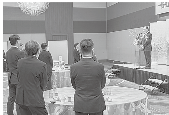
●懇談会(大野元裕埼玉県知事もご来場)